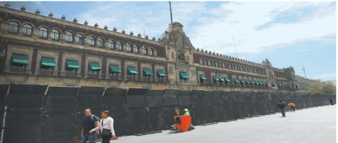
RAÚN MONTAÑO, EL UNIVERSAL