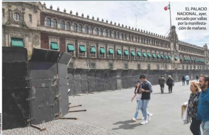
EL PALACIO NACIONAL, ayer, cercado por vallas por la manifestación de mañana.

BUSCAN organizadores que regresen corruptos al poder: Presidente; señala Delgado que Córdova quiere poner en duda comicios.