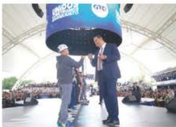
EL GOBERNADOR de Guanajuato en su 6° informe, ayer.

ENSU 6° informe, el gobernador de Guanajuato señala que siempre hubo soluciones ante adversidades como la financiera o sanitaria. pág. 10