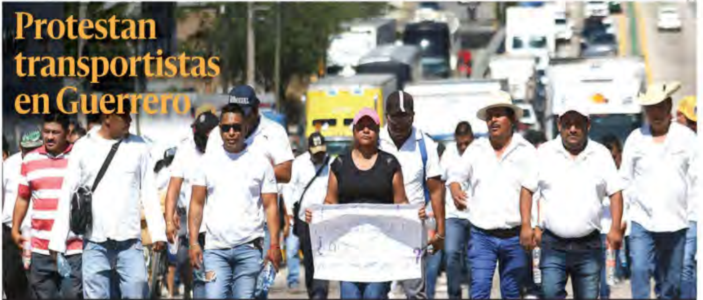
Con consignas en cartulinas como "Tengo miedo, pero por amor a Chilpancingo me tengo que manifestar", "Auxilio, Gobierno del estado, nos están matando", choferes del transporte público de Guerrero protestaron ayer para exigir seguridad ante una nueva ola de violencia del crimen organizado. PAG 10