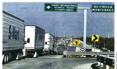
La falla en Aduanas provocó largas filas en los puntos fronterizos.

Critican empresarios deficiencia del SAT; reportan robos a camioneros detenidos NALLELY HERNÁNDEZ Y ALEJANDRA MENDOZA