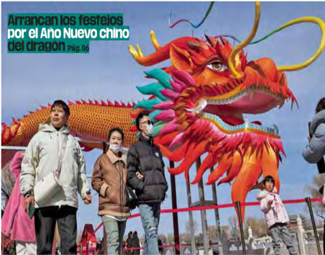
Mundo. En la CDMX se dará la bienvenida al Año Nuevo en el Cenart donde habrá espectáculos, artes marciales y varias actividades este fin de semana.

Arrancan los festejos por el Año Nuevo chino del dragon Pág. 06