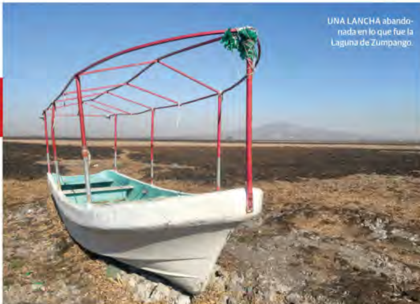
UNA LANCHA abandonada en lo que fue la Laguna de Zumpango.

CONGRESO de CDMX vuelve a dejar en vilo tema del agua; Morena y PAN rompen quorum ; se pediría declarar emergencia.