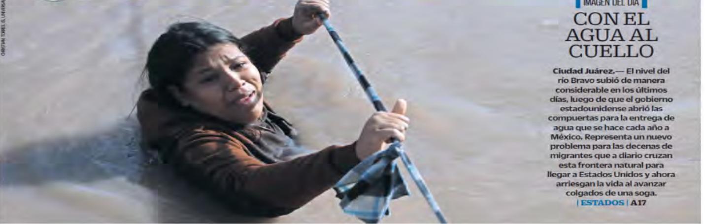
IMAGEN DEL DÍA CON EL AGUA AL CUELLO

Ciudad Juárez. — El nivel del río Bravo subió de manera considerable en los últimos días, luego de que el gobierno estadounidense abrió las compuertas para la entrega de agua que se hace cada año a México. Representa un nuevo problema para las decenas de migrantes que a diario cruzan esta frontera natural para llegar a Estados Unidos y ahora arriesgan la vida al avanzar colgados de una sogas.