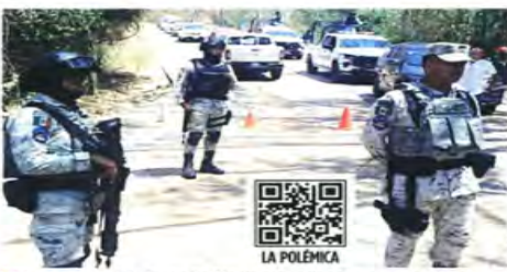
Elementos de la Guardia Nacional arribaron ayer al campo de golf de Ricardo Salinas Pliego ubicado en Oaxaca.

DERRAME EN LA L12 Material de construcción, lodo y agua se derramó ayer sobre un tren en la estación Eje Central de la Línea 12 del Metro. El Gobierno de la CDMX aseguró que el incidente está relacionado con una obra autorizada por la Alcaldía Benito Juárez. CIUDAD