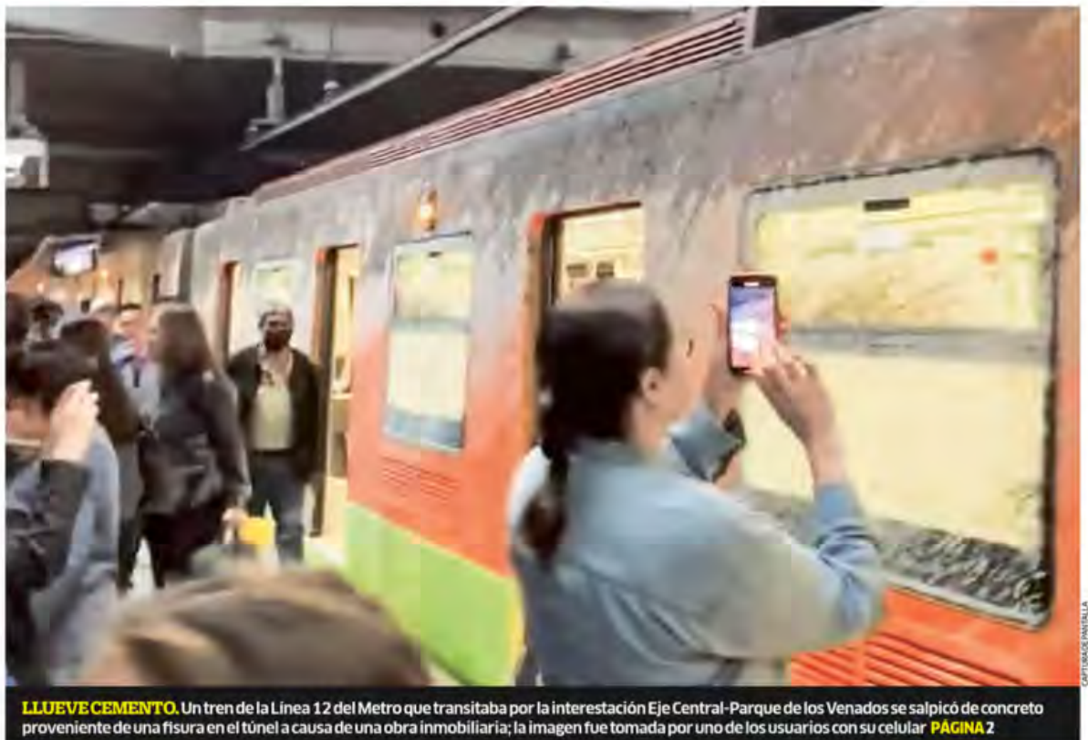
LLUEVE CEMENTO. Un tren de la Línea 12 del Metro que transitaba por la interestación Eje Central-Parque de los Venados se salpicó de concreto proveniente de una fisura en el túnel a causa de una obra inmobiliaria; la imagen fue tomada por uno de los usuarios con su celular PÁGINA 2