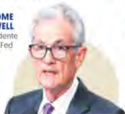
JEROME POWELL Presidente de la Fed

“Será apropiado comenzar a reducir las tasas hasta que estemos más seguros de que es así. Dije eso muchas veces...”