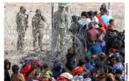
MIGRANTES se enfrentaron ayer a la GN en Texas.

SRE a paisanos: "No están solos"; Senado y gobernadores de 4T repudian; Ebrard anticipa "turbulencia"; ve apartheid ; Claudia: mejor puentes que muros; Gálvez pide subir protesta