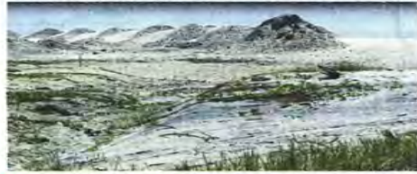
En las playas sinaloenses de El Patole, el crimen organizado realiza actividades de extracción de oro.