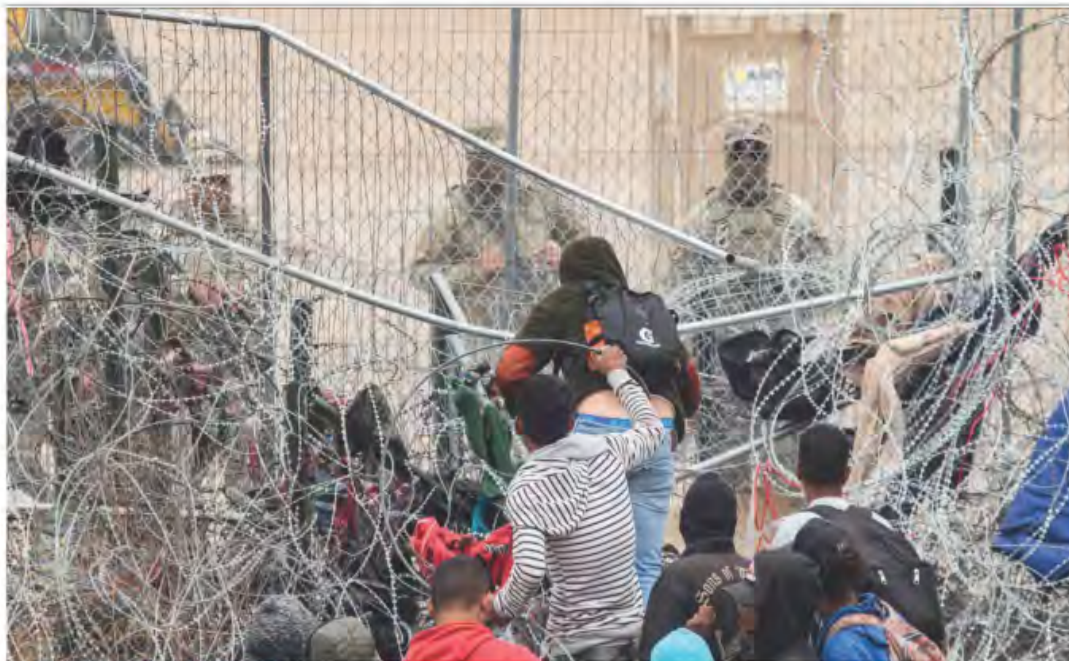
INCERTIDUMBRE EN LA FRONTERA. En tanto se define en Estados Unidos la constitucionalidad o no de la ley antimigrante que impulsa el republicano Greg Abbott, gobernador de Texas, el flujo de personas que esperan cruzar a Estados Unidos no para. La imagen, en la zona fronteriza texana. Pág. 13