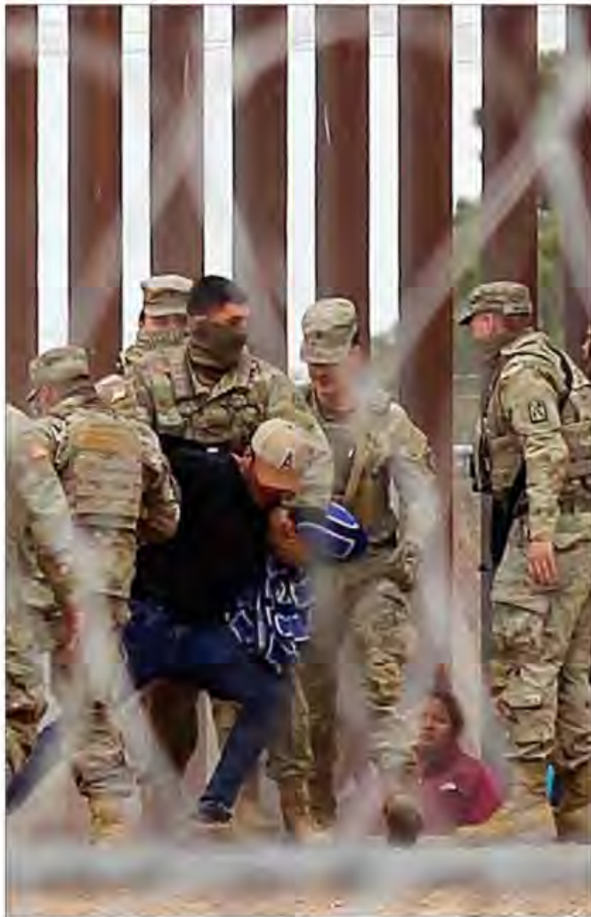
▲ Unos 80 migrantes intentaron derribar una malla ciclónica luego de cruzar el río Bravo hacia Estados Unidos desde

“Firme rechazo a la SB4 y a las deportaciones de migrantes”