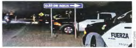
Los cuerpos estaban en un área des poblada de la carretera a Ojo de Agua, en Pesquería, Nuevo León.

Claudia Sheinbaum, candidata presidencial de la coalición que encabeza Morena, estará hoy en ese municipio. Alrededor de las 18:30 horas, las autoridades fueron alertadas de que en el lugar fue abandonada una minivan Honda Odyssey de reciente modelo. El vehículo fue incendiado y en su interior había tres cuerpos calcinados. Policías municipales, agentes ministeriales y elementos del Ejército y de la Guardia Nacional acudieron a la zona, ubicada antes de la carretera a Miguel Alemán, ordenando cerrar el lugar y ampliando la inspección de la zona. Una fuente policial informó que a unos metros de la minivan fueron localizados al menos otros siete cuerpos calcinados. Indicó que, por las condiciones en que quedaron los cadáveres, no había sido posible determinar la cantidad precisa de víctimas, ni tampoco su sexo. Por las evidencias, agregó la fuente, los agentes consideraban que las víctimas fueron asesinadas en otra parte. Hasta anoche, peritos de la Fiscalía General inspeccionaban el lugar. Según la agenda anunciada, en su segundo día de gira por Nuevo León, Sheinbaum se reunirá con medios de comunicación en Apodaca, y luego acudirá a un mitin en Pesquería, a las 11 horas. Posteriormente continuará su gira por Juárez y Guadalupe.