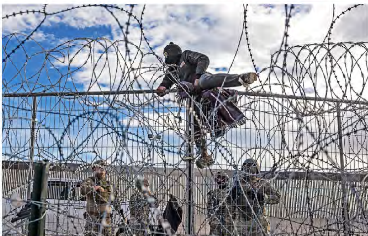
ALCANZAR EL SUEÑO. La crisis no cesa en la frontera norte, cientos de migrantes intentan cruzar a Estados Unidos sin importar el riesgo, justo en medio del proceso electoral en el que este tema se torna como central MUNDO P. 16