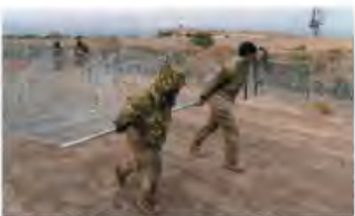
La GN de EU coloca más alambres de púas, ayer, en El Paso, Texas.

SE AVALARON los 21 puntos del pliego petitorio y 4 beneficios más, afirma; acusa a líderes paristas de acoso y extorsión; los llama delincuentes, mercenarios... pág. 13