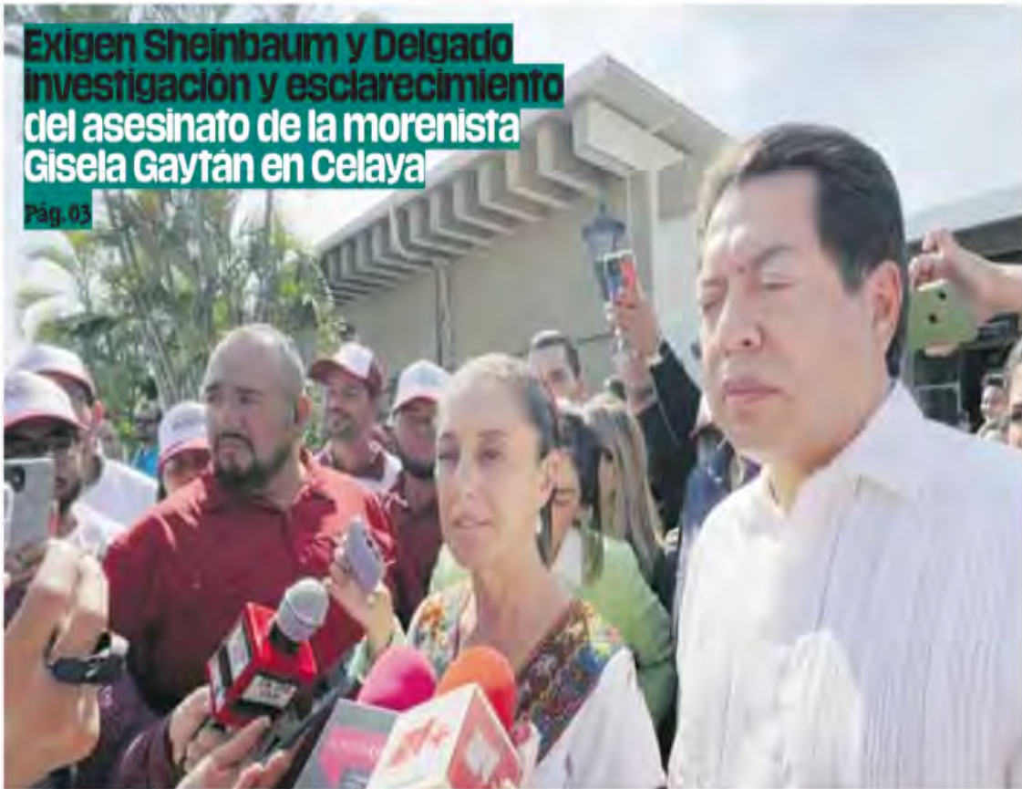
Nacional. A su llegada a Colima, la exjefa de Gobierno puntualizó que es fundamental que se indague la actuación del órgano electoral guanajuatense.