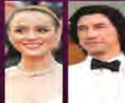
Nathalie Emmanuel, actriz Adam Driver, actor

Megalópolis, la esperada cinta de Francis Ford Coppola, dividió opiniones en Cannes. / 6