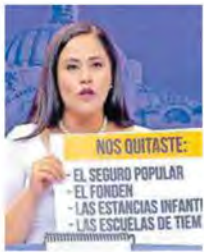
CAPTURAS DE PANTALLA