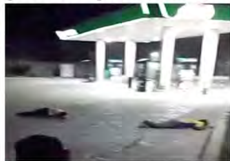
Tras el ataque armado, los cuerpos de las víctimas quedaron cerca de una gasolinera.