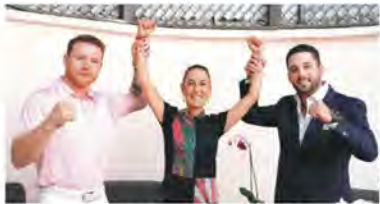
EL BOXEADOR (IZQ.) posa junto a la candidata presidencial ayer.

EL PUGILISTA se reúne con Sheinbaum para expresar su apoyo; "yo sé que va a ganar", le dice; la candidata de la 4T llama a abarrotar las urnas