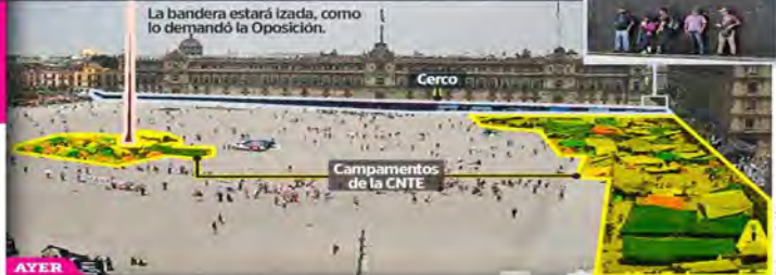
La bandera estará izada, como lo demandó la Oposición.

El domingo, cuando la Marea Rosa desemboque en el Zócalo, algunas áreas estarán ocupadas por el plantón de la CNTE y por el cerco policiaco que protege Palacio Nacional.