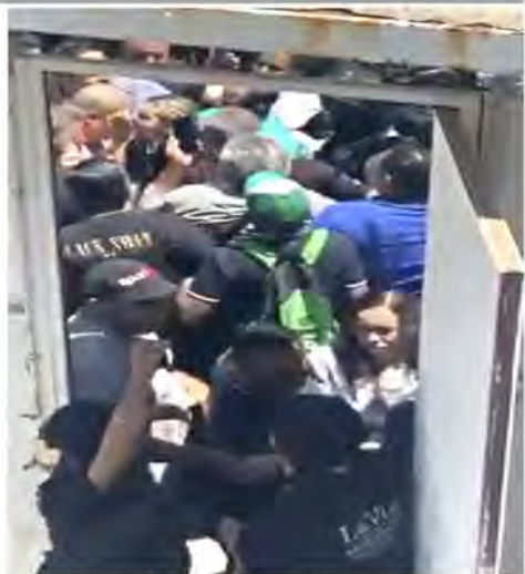
■ Activistas de Morena arremetieron contra un trabajador del IEPAC que portaba una bolsa de basura con boletas marcadas en favor del partido quinda.