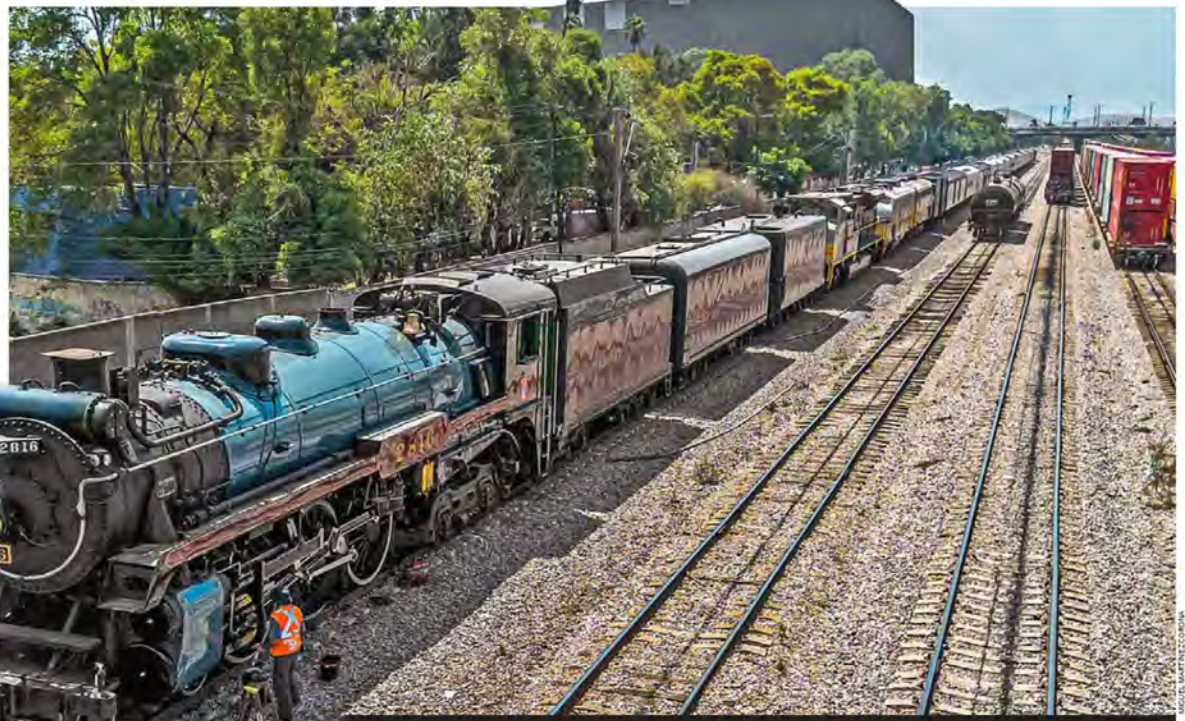
PAUSA PARA LA NOSTALGIA. Gran revuelo provoca el paso de La Emperatriz , este miércoles hizo una parada cerca de la estación Fortuna del suburbano, donde lo resguardan antes de su exhibición mañana en Polanco. CDMX P. 8

...Yen Jalisco comenzó recuento El partido guinda busca eliminar el resultado para varios cargos ESTADOS P. 10