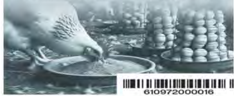
Ilustración: A. Gracia / REFORMA

fallecido informaron que desarrolló fiebre, dificultad para respirar, diarrea, náuseas y malestar general. La Secretaría de Salud informó que se trata de una cepa de baja patogenicidad y que el consumo de carne de pollo o huevo bien cocidos no representa peligro para la salud.