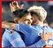
Harry Kane, delantero inglés.