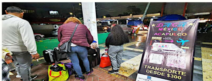
Uno de los sitios para abordar transportes ilegales se ubica cerca del Metro General Anaya.

Economistas de la Comisión Independiente para la Igualdad con Justicia Fiscal plantean reformar el sistema fiscal mexicano para que sea justo, equitativo y eficiente, y sea el motor para la prosperidad. PÁGINA 14