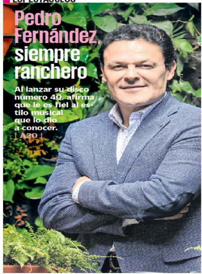
GABRIEL PANO, EL UNIVERSAL

Al lanzar su disco número 40, afirma que le es fiel al estilo musical que lo dio a conocer. | A30 |