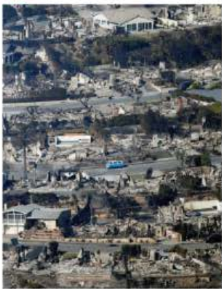
VISTA aérea muestra devastación en Pacific Palisades, en Los Angeles, California, ayer.