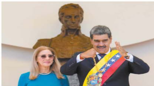
Nicolás Maduro, después de su ceremonia de juramento en la Asamblea Nacional, en Caracas.

33.2% CAIDA EN ASISTENCIA A CINES en México respecto a 2019.