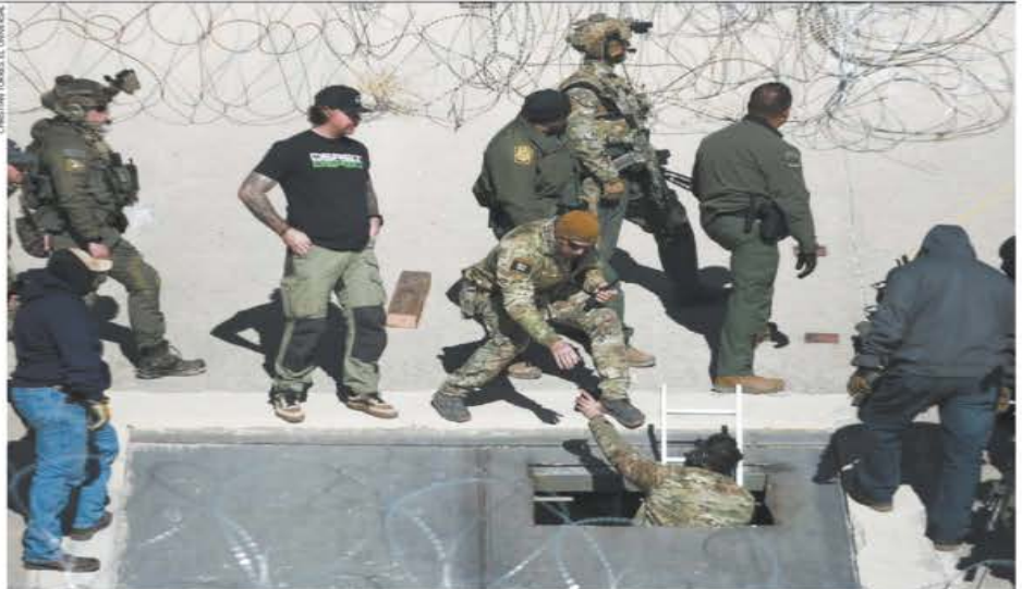
Fuerzas estadounidenses desmantelaron el túnel que conectaba la frontera de Ciudad Juárez, Chihuahua, con El Paso, Texas.