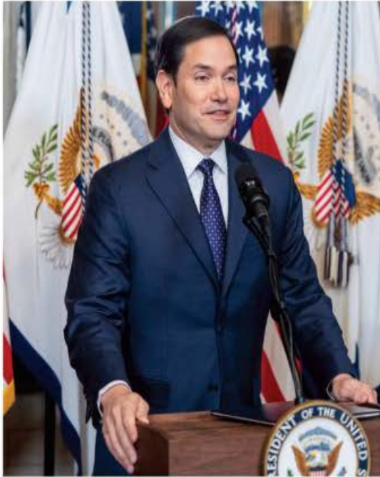
Marco Rubio, el primer hispano en liderar la diplomacia estadounidense, juró al cargo de secretario de Estado de EU y omitió aclarar si habrá intervención militar en México. PAG. 20