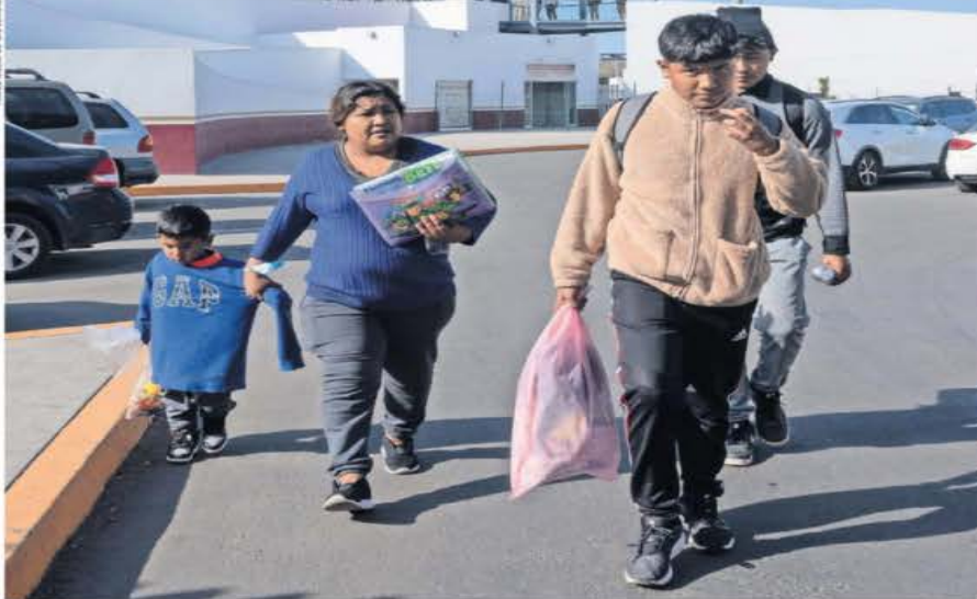
Una mujer con sus tres hijos, dos adolescentes y un niño, fueron de los primeros deportados desde Estados Unidos por la frontera de Tijuana, Baja California. Uno de los menores clamaba: "No somos criminales". | A7 |