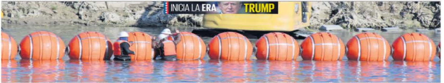
Con maquinaria pesada, trabajadores estadounidenses reforzaban ayer las boyas colocadas en el río Bravo, a la altura de la frontera entre Piedras Negras, Coahuila, y Eagle Pass, Texas. Se prevé que coloquen más. | A7 |