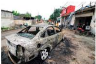
UN AUTO quemado, ayer, en Villahermosa.

SUJETOS armados incendian comercios y vehículos; aparecen amenazas en narcomantas. pág. 14