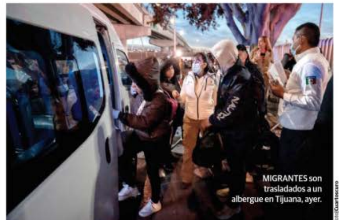
MIGRANTES son trasladados a un albergue en Tijuana, ayer.

CALCULA Imumi 200 mil migrantes varados en el país; en Huixtla, Chiapas, avanza caravana entre miedo e incertidumbre. pág. 6