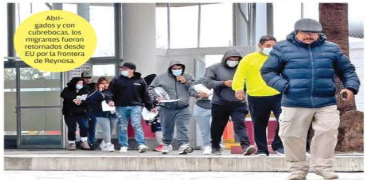
Abri-gados y con cubrebocas, los migrantes fueron retornados desde EU por la frontera de Reynosa.