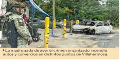
La madrugada de ayer el crimen organizado incendió autos y comercios en distintos puntos de Villahermosa.

Desde diciembre de 2023, a "La Barredora" la ligan con el tráfico de droga, migrantes, huachicol, trata de personas y también con la narcoviolencia en la entidad, debido a su pugna con integrantes del Cártel Jalisco Nueva Generación (CJNG).