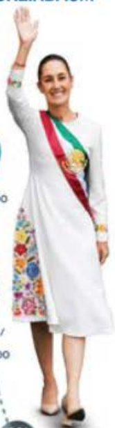
GRÁFICO: JORGE PEÑALOZA