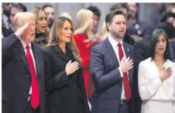
Misa de investidura. Trump y Vance durante un servicio religioso en Washington.

SOBRE CÁRTELES Ve acuerdos con EU, pero cada quien en su territorio.