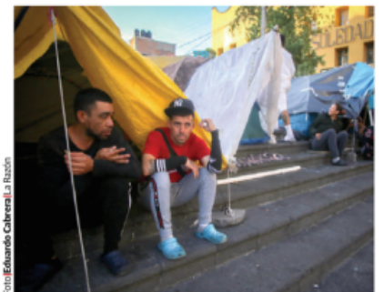
MIGRANTES en Plaza de la Soledad, en el Centro, ayer.

SE ORGANIZAN en Los Ángeles, NY, Chicago, Phoenix...; arman patrullajes para alertarse de posibles redadas; otros tienen miedo y no quieren salir.