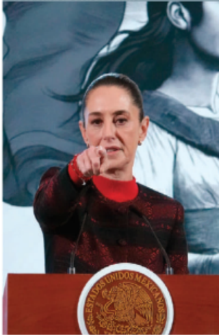
LA PRESIDENTA en conferencia, ayer.