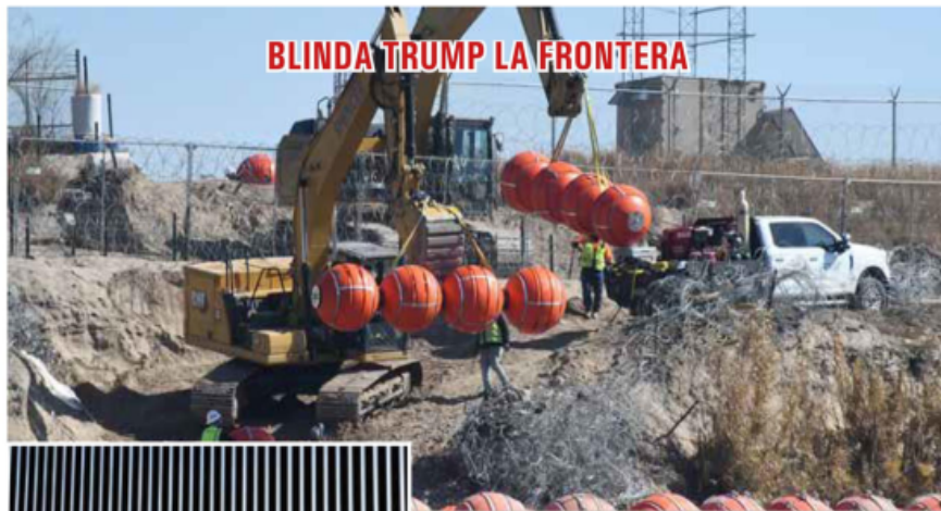
BLINDA TRUMP LA FRONTERA

Por Redacción / El Independiente / EDITORIAL HispanicLA : Trump y los inmigrantes: al final, la justicia prevalecerá ▶ 12 y 13