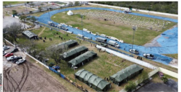
REFUGIO temporal que FA y municipales construyen para migrantes en Matamoros.

NOROÑA admite que hay pendientes más de 60 reformas a leyes secundarias de tipo migratorio; Monreal se dice abierto a que se revise el presupuesto y leyes de respuesta a Donald Trump. págs. 9 y 10