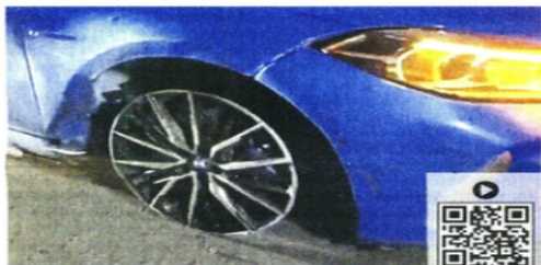
Los delincuentes lanzaron ponchallantas en la vía de cuota en Puebla.

"Nuestras relaciones diplomáticas con otros países, particularmente en el hemisferio occidental, darán prioridad a la seguridad de las fronteras de EU, a la detención de la migración ilegal, y a la negociación de la repatriación de los inmigrantes ilegales", dijo Rubio.