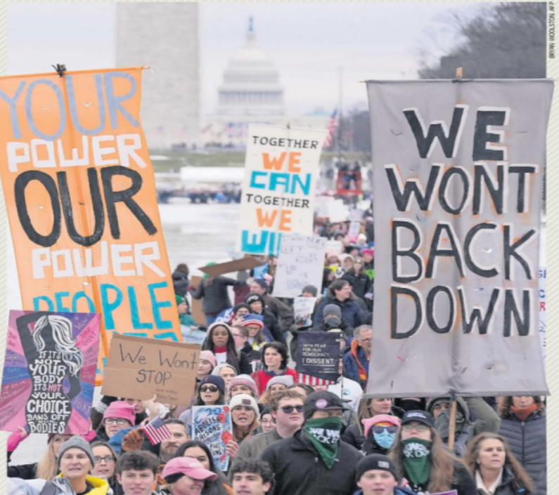
A dos días de la toma de posesión de Donald Trump como presidente de Estados Unidos, decenas de miles de personas contrarias a las políticas del magnate asistieron a la Marcha del Pueblo en Washington.