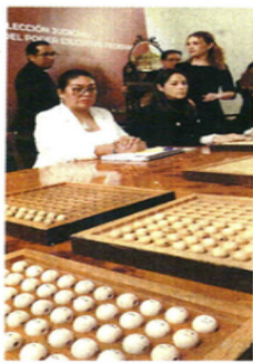
Las listas de aspirantes salieron por tómbola.