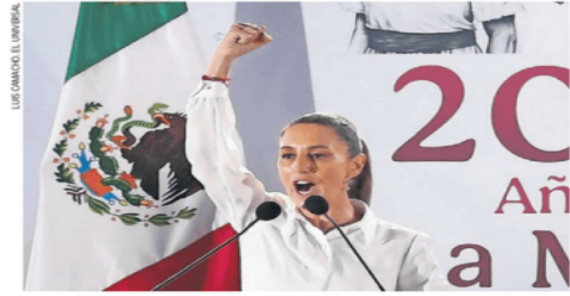
La presidenta Claudia Sheinbaum consideró que el aumento de 25% en los aranceles es un "tiro en el pie" para el país vecino.