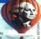
Ilustración: M. Grupo Reforma

20.68 pesos cerró el 1 de febrero, tras el anuncio de Trump