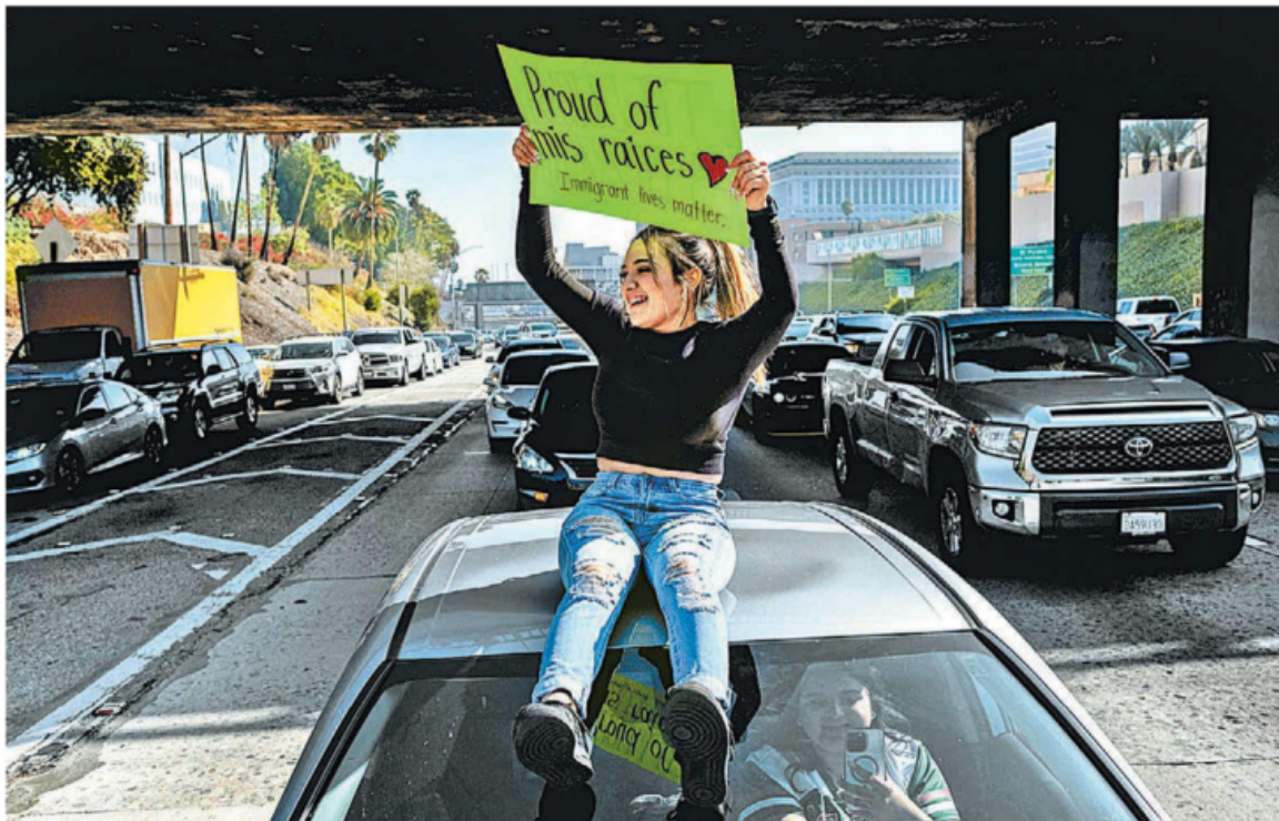
"Orgullosa" protesta de paisanos en la Ruta 101, en Los Ángeles, contra arrestos y deportaciones.