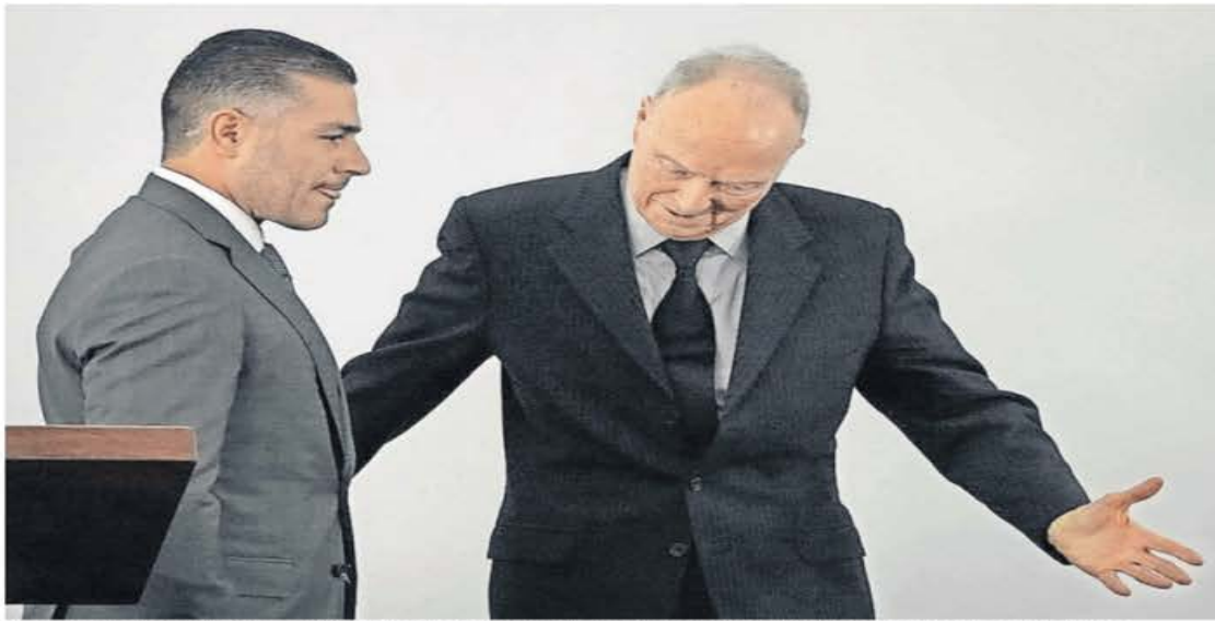
El secretario de Seguridad y Protección Ciudadana, Omar García Harfuch, y el fiscal General de la República, Alejandro Gertz Manero, durante la conferencia de prensa en la que dieron pormenores del traslado de 29 capos mexicanos a Estados Unidos realizado el 27 de febrero.