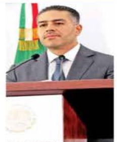
Harfuch encabezó la conferencia del Gabinete de Seguridad.

El Gabinete de Seguridad cuenta con información de que existía un riesgo de que algunos de estos objetivos solicitados por el gobierno de Estados Unidos fueran liberados.